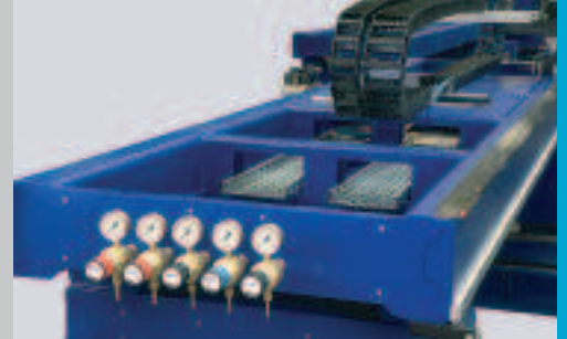
Portalbrücke mit Doppelsektions-Aufbau für hohe Steifigkeit und geringe Masse. Twin bridge design for high rigidity and low mass.