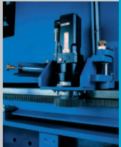
Luftgefederte doppelseitige Längsantriebe gewährleisten hohe Produktivität und Genauigkeit. Air sprung twin AC drive motors for increased productivity and accuracy.